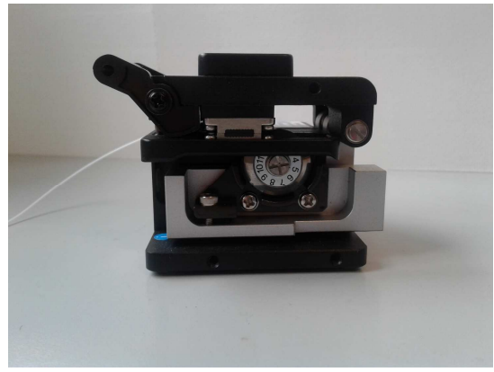
7. Spostare in avanti il meccanismo della lama.