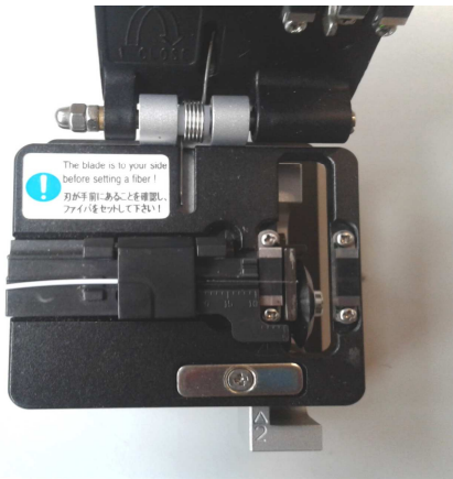
9. Aprire il coperchio della taglierina.