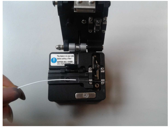
10. Togliere il cavo di fibra ottica e rimuovere la fibra ottica di scarto

Attenzione: i frammenti di fibra ottica possono essere pericolosi se giungono in contatto con occhi, pelle o se ingeriti.