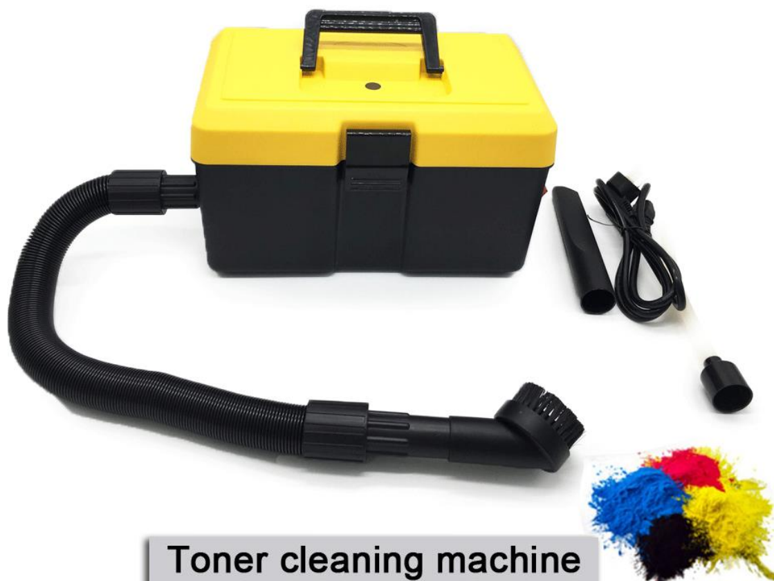
Toner cleaning machine