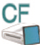
Compact Flash (J:)