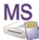
Memory Stick (M:)

È possibile eseguire operazioni di lettura e scrittura.