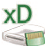
xD Picture (K:)