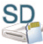
SD Card (L:)