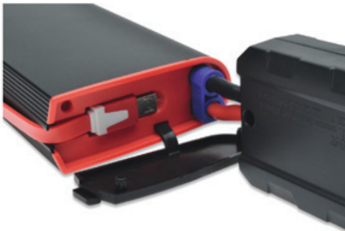
Abbildung 2: Die Klemmen für den EC5-Ausgang sind an die Fahrzeugbatterie angeschlossen.

1. Bei schwacher Spannung in der Fahrzeugbatterie wird die Batterie