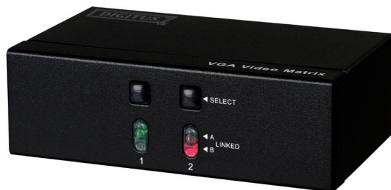
2 wejścia 2 wyjść (DS-47110-1)