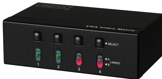
2 in 4 ut (DS-48110)