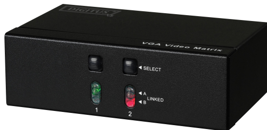
2 in 2 ut (DS-47110)