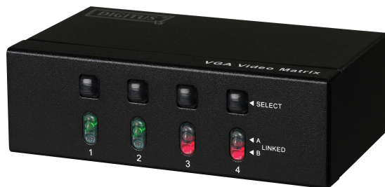
2 in 4 out (DS-48110)