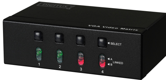
2 Eingänge 4 Ausgänge (DS-48110)