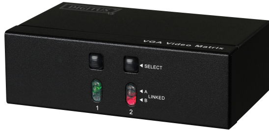
2 Eingänge 2 Ausgänge (DS-47110)