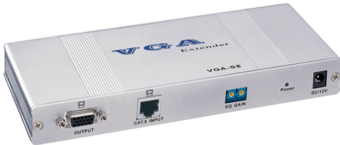
DC-53602 / DC-53702