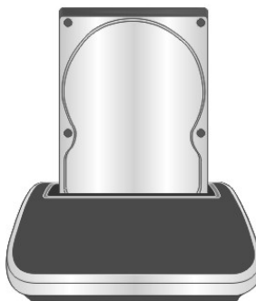
Instalacja dysku 3,5"