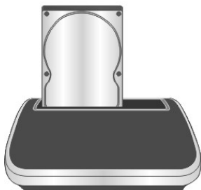
Instalacja dysku 2,5"